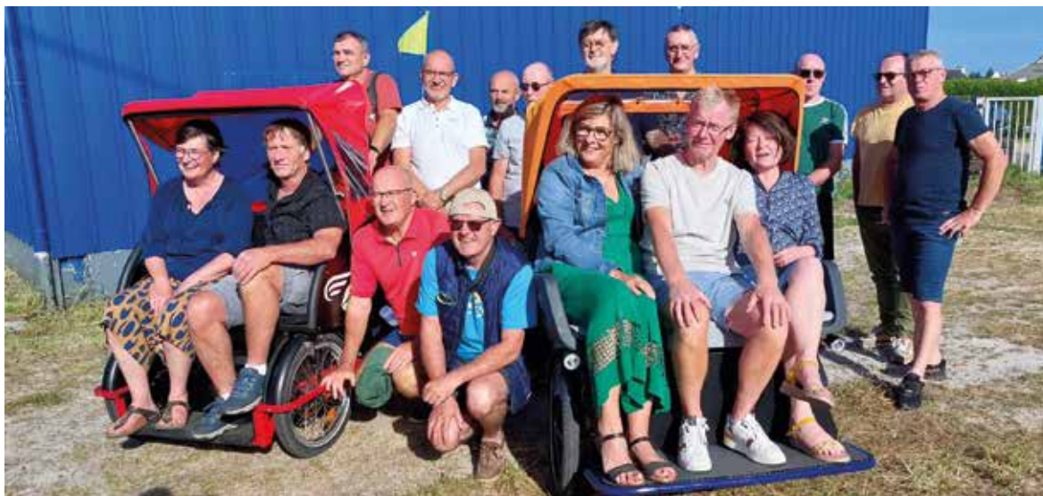
Un bénévole heureux de partager

En 2025, encore de belles balades en prévision (retour des triporteurs début mars), avec des formations de pilotage prévues dès février prochain. Malgré ses 40 pilotes, l'antenne recrute afin de proposer encore plus de promenades (de nouveaux établissements et structures souhaitent découvrir cette activité à Pont-Scorff).