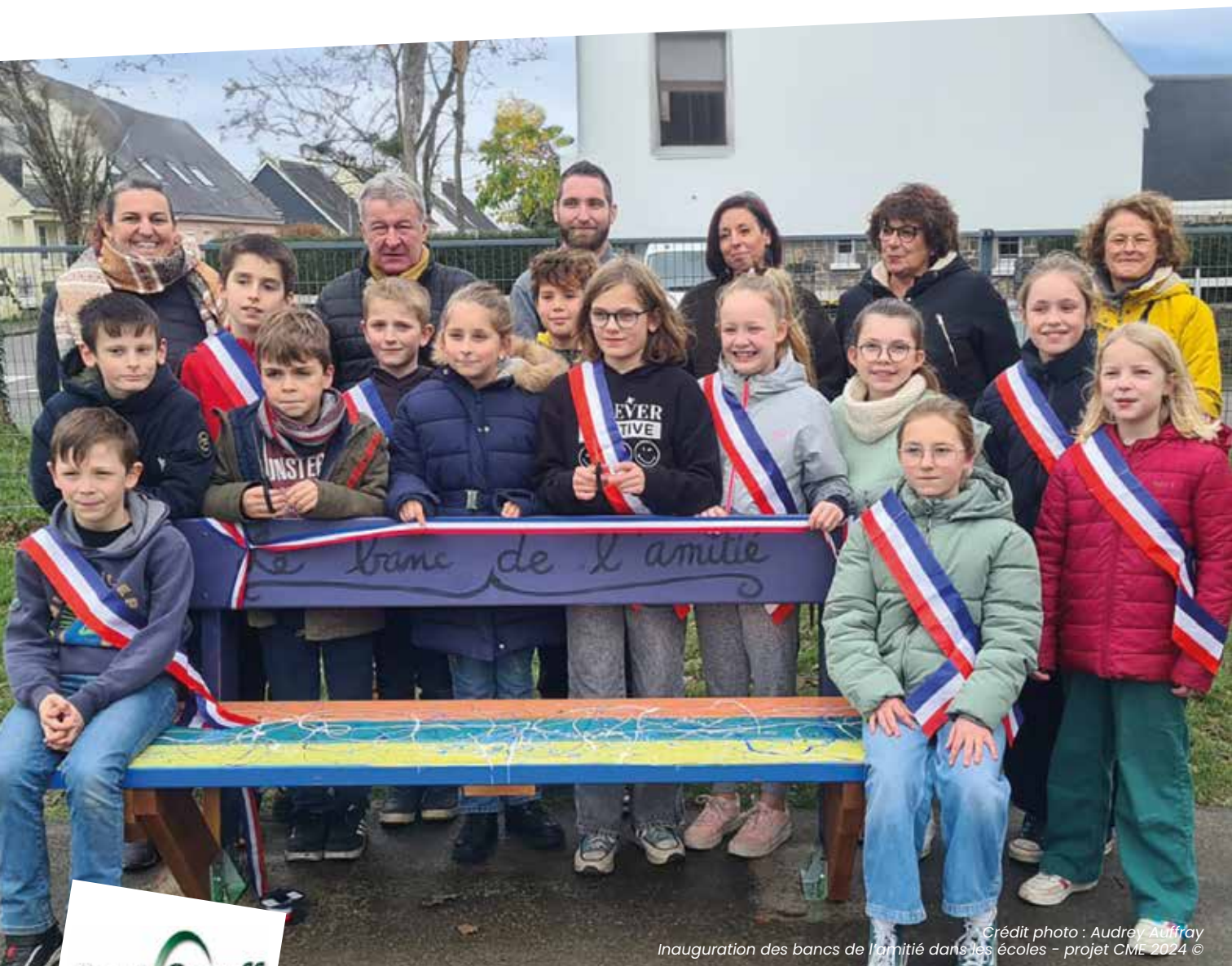
Inauguration des bancs de l'amitié dans les écoles - projet CME 2024

BULLETIN MUNICIPAL DE LA COMMUNE DE PONT-SCORFF