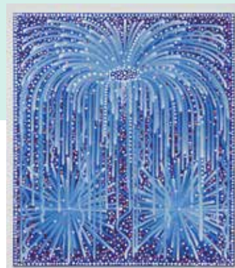
Crédits photographiques : Hugo Capron, Feu d'artifice (Méditerranée), 2024, oil on canvas, 230 x 200 cm. Photo Pauline Assathiany. Courtesy Semiose, Paris©.

Hugo Capron est représenté par la galerie Semiose - Paris