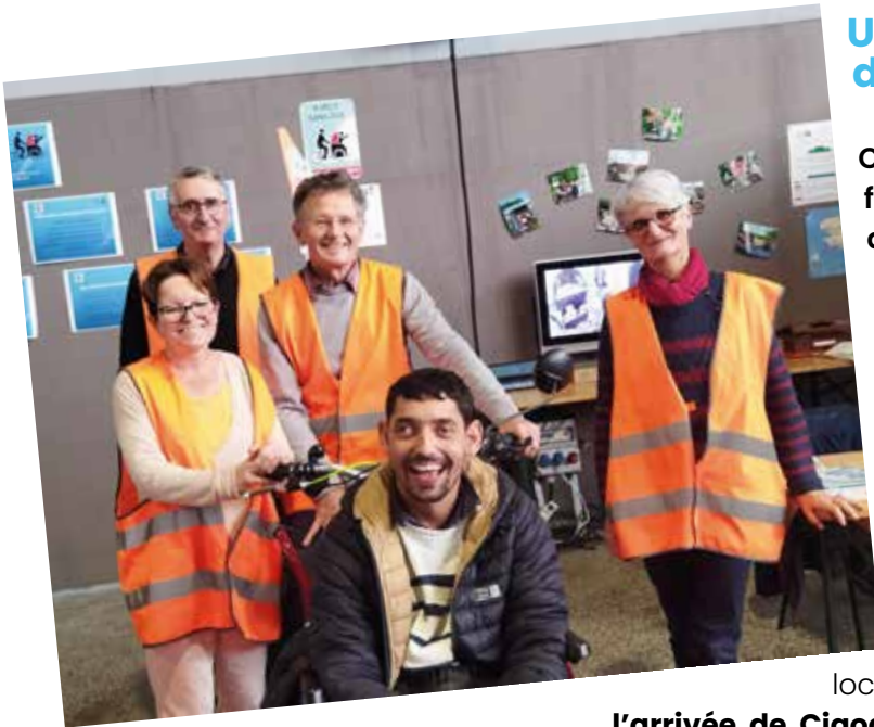
Une participation au forum Les Accessibles relatif aux handicaps

Que de chemin parcouru en un an! Et tout ceci, grâce à l'engagement des partenaires (dons toujours possibles via la plateforme HelloAsso) et de l'équipe de bénévoles. Merci à eux!